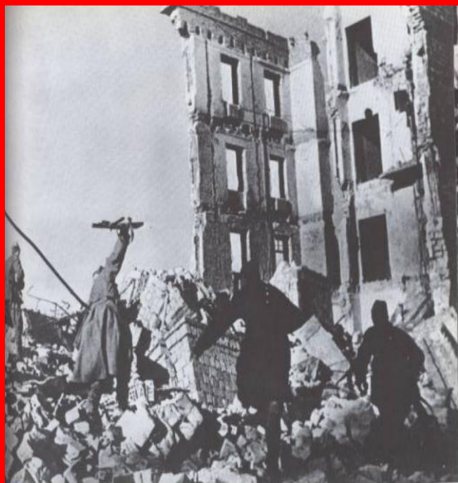
В результате ростовской наступательной операции советские войска продвинулись на 300-450 километров, освободили большую часть Ростовской области и 18 февраля перешли к обороне на рубеже реки Миус.